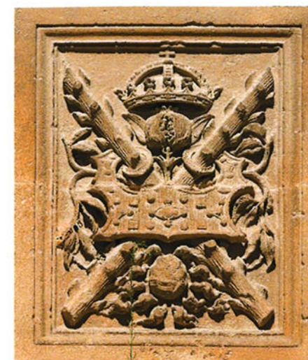
Bourgondisch kruis met vuurslag in het paleis van Karel V in het Alhambra (circa 1530)

In 1999 werd voor de kust bij het Zeeuwsche Ritthem in de Westerschelde een scheepswrak ontdekt met enkele kanonnen. Een daarvan vertoont een ingekerfd Bourgondisch kruis. 4 Op de bewaard gebleven klokken treffen