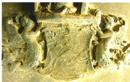
De uitgehakte wapens Ripperda op de Pontianusklok.

De Pontianusklok in de kerk van Farmsum is een zwaar gehavend kunstwerk. Rond 1600 zijn tekst en wapens grotendeels door de kerkvoogden van Noorddijk weggehakt om te verdoezelen dat zij de klok onrechtmatig verkregen hadden en zich aan heling hadden bezondigd. 1 Enkele jaren geleden lukte het echter na ruim vier eeuwen de oorspronkelijke tekst te reconstrueren. Van een van de drie wapens bleef echter onduidelijk welke voorstelling erop geprikt heeft.