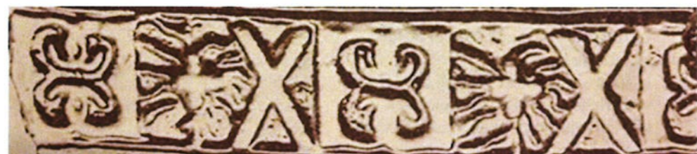
Keten van de Orde van het Gulden Vlies, met vuurslagen, vlammen met vuurstenen en andreas-kruisjes, op de Mariaklok te Bolsward van Gobel Zael (1533)

noordelijke en oostelijke gewesten. Dat bewijst in elk geval dat de symboliek bekend was bij de gieter van de Pontianusklok en dat maakt het waarschijnlijk dat het matrijs voor het kruis op die klok niet speciaal daarvoor vervaardigd was, maar al tot het beschikbare materiaal van Gobel Zael behoorde. Een matrijs