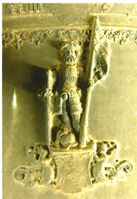
Sint-Pontianus op de Pontianusklok.

Een vermelding uit de stadsrekeningen van 's-Hertogenbosch gaf een aanwijzing voor een vermoedelijke oplossing. In 1541 bestelt die stad nieuw geschut in Utrecht bij de meester-busgieter Jan Tolhuis ('Jan van Zanten') aldaar. De stad laat een wapen schilderen om als model te dienen en in 1542 wordt het stadswapen met een arend en een andreaskruis in hout gesneden als matris voor het te gieten wapen op de kanonnen. 2