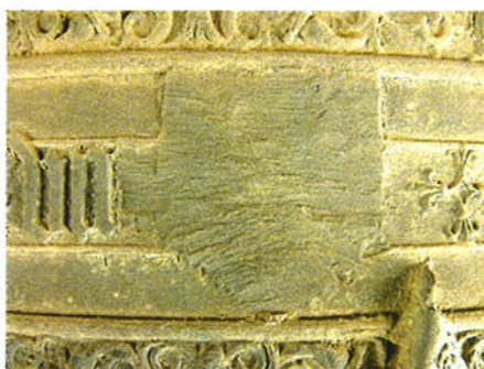
Het uitgehakte wapen in het randschrift van de Pontianusklok.

In Groninger wapens zijn schuinkruizen in deze periode vrij zeldzaam.