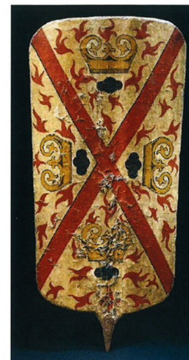
Bourgondisch schild uit de tweede helft van de vijftiende eeuw met andreaskruis, vuurslagen en vlammen