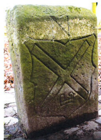
Grenspalen 5 (links) en 6 (rechts) bij Losser met Bourgondisch kruis en vuurslag in een wapenschild (1548)