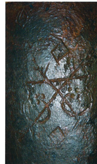
Ingegraveerd Bourgondisch kruis met vuurslag op een kanon uit het zestiende-eeuwse scheepswrak bij Ritthem