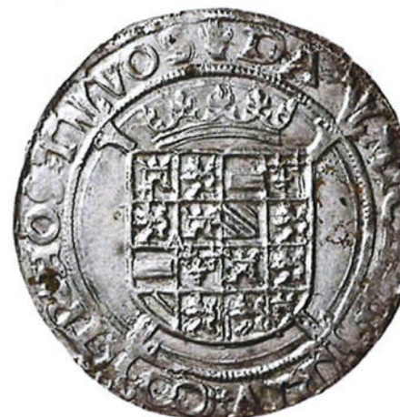
Vlieger met het wapen van Karel V geplaatst op een Bourgondisch kruis (1537)