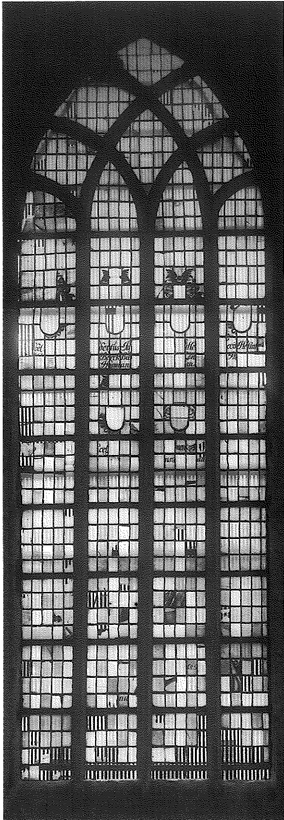
2 Het gilderaam vóór de restauratie van 1923.

die Gilden het burgerlijk regiment twee en twee compagnien off derselver officieren sullen worden gestelt in een glas'. Voordien blijken dus in het koor glas-inloodramen te hebben gezeten van de verschillende gilden in de stad. Gezien de interne politieke situatie van de stad Groningen in die jaren is het niet verwonderlijk dat burgemeesters en raad de ramen van de gilden naar de glasbak verwezen: de jaren tot 1663 werden gekenmerkt door strijd tussen het stadsbestuur en de gilden, die verlaging van lasten en politieke invloed nastreefden. Hun drie leiders werden in 1663 en 1665 onthoofd 4 .