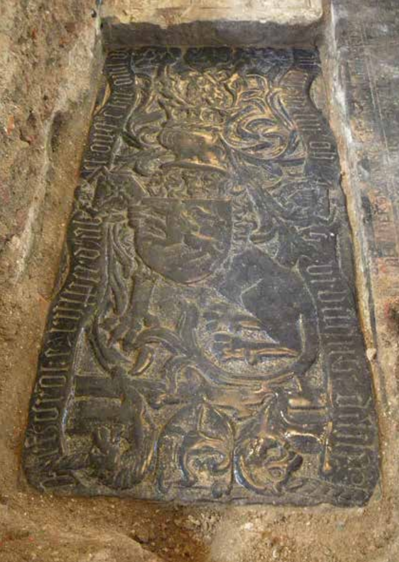
3 De grafzerk van Frouke Onsta (1477).