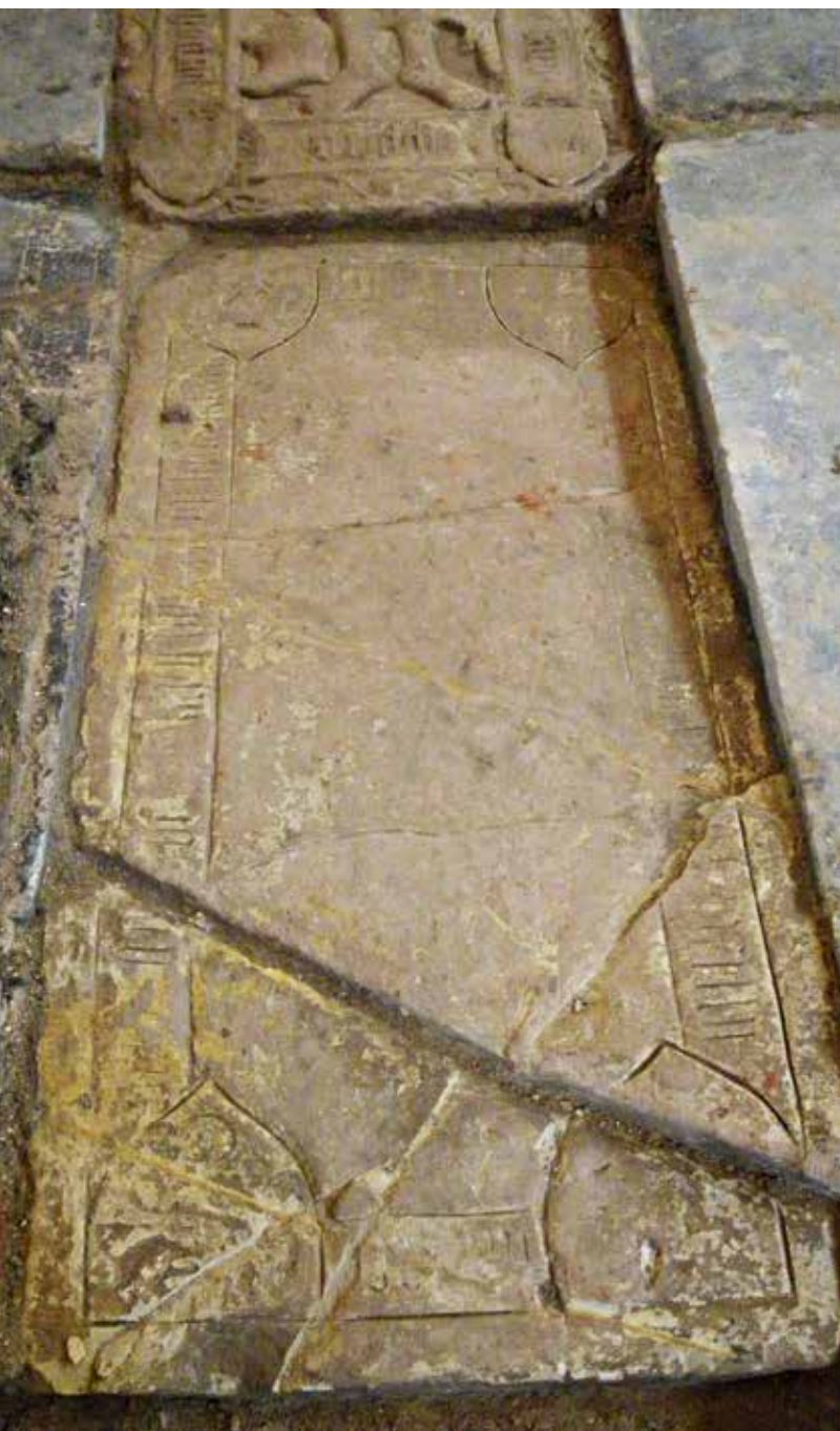
1 De grafzerk van Unico Ripperda (1474).