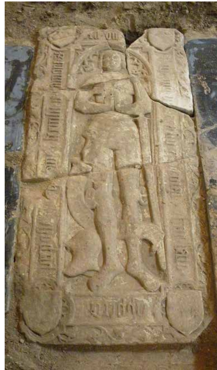
4 De grafzerk van Haye Ripperda (1504).

grafzerken van vóór 1520 geen enkele die de kwartierwapens in de latere standaardvolgorde voor de vier grootouderlijke wapens vertoont. Daaruit mag duidelijk zijn dat de vondst van groot belang is voor onze kennis over de heraldische beeldprogramma's op Groninger zerken.