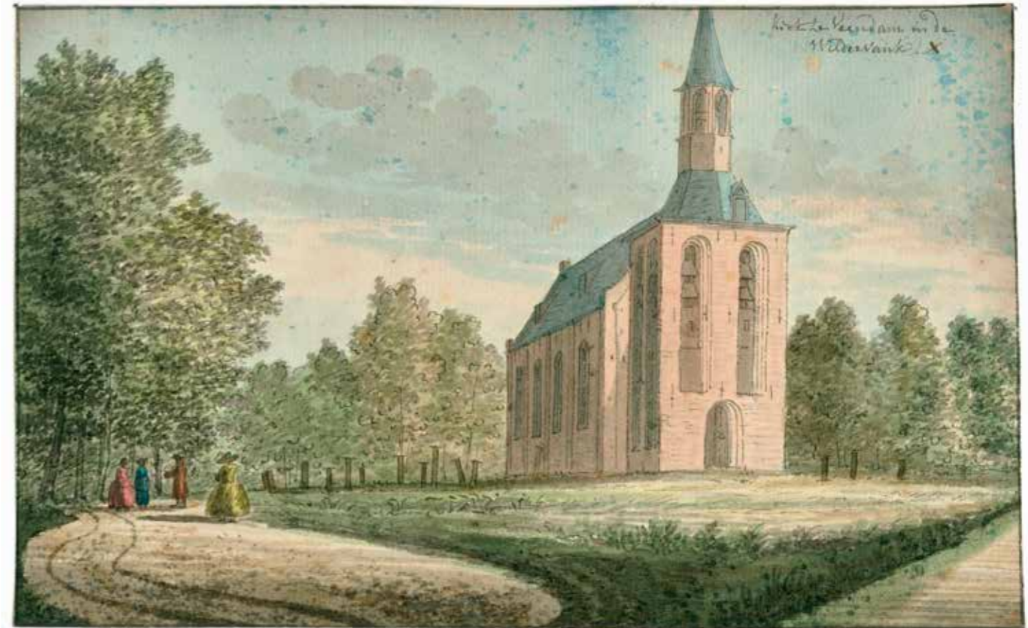
8 De kerk van Veendam op een tekening van vóór 1765. In de toren hing van 1665, het jaar van de bouw, tot 1957 een ooit uit Appingedam geroofde klok.

Na veertien jaar werd de stad op 22 juli 1594 heroverd door Maurits en teruggebracht onder het staatse gezag. De katholieke factie werd afgezet en Stad en Lande deelden weer dezelfde bevoorrechte godsdienst en het centrale gezag. De oude ressentimenten bleven intact, maar men was in elk geval weer op sprekende voet. Van die omstandigheid maakten de burgemeesters van de stad Appingedam al snel gebruik om aan Groningen hun klokken terug te vragen. Deze laatste had ondanks de veranderde politieke situatie en een compleet vernieuwde stadsregering nog weinig van haar oude streken verloren. Allereerst bleef het verzoek van de burgemeesters van de stad Appingedam ongelezen. Men antwoordde slechts dat als de buurrechters namens de gemeente aldaar een verzoek wilden doen, dezen de raad konden schrijven. 'Burgemeesters' van een 'stad' Appingedam be- weerde men niet te kennen. Het zou nog lang duren voordat Groningen dit soort kinderachtigheden achterwege zou laten.