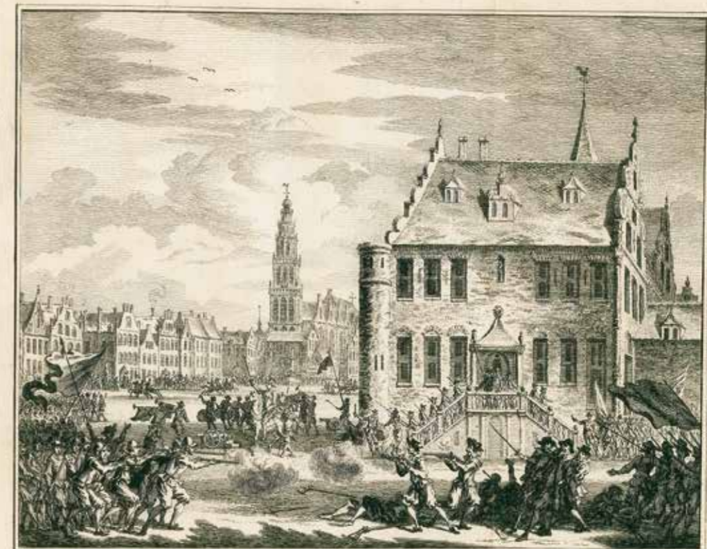
GRONINGEN, door den Graave van Rennenberg, aan de Spaansche zyde overgebracht, in 't jaar 1580.