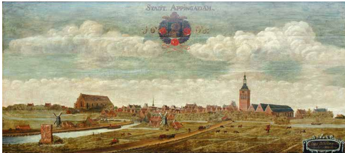
7 Gezicht op Appingedam door Claes Hendericx, 1665. Collectie gemeente Appingedam.