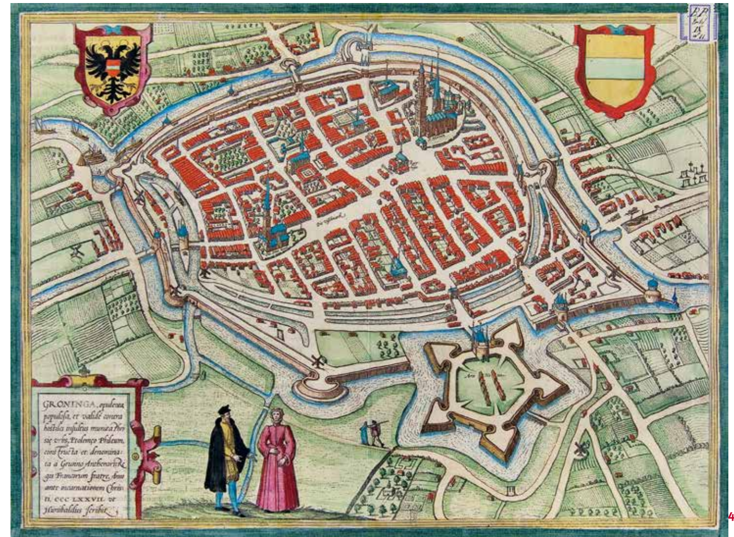
3 Kaart van Groningen uit 1577, met rechtsonder een – geflatteerde – weergave van het dwangkasteel van Alva.

De zes grootste klokken waren in elk geval zo beschadigd dat zij alleen het brons nog als klokkenspijs kon dienen. 6 De financiën voor de reparatie werden ingezameld door een col-