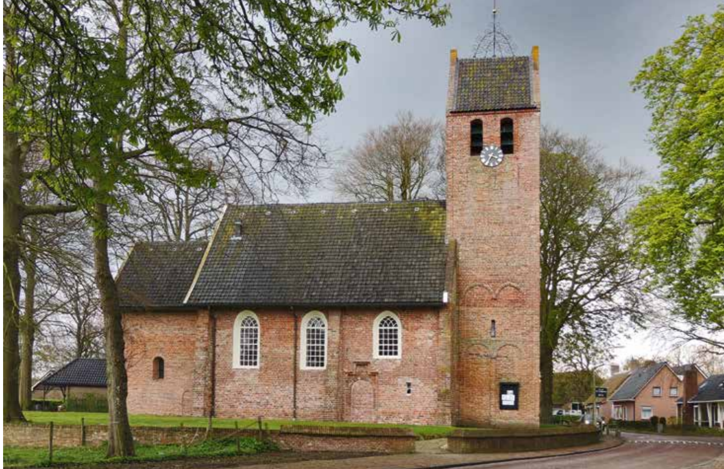
9 De Bartholomeuskerk van Noordlaren.

tegen Noordlaren aanvankelijk uit ‘om moverende redenen’ en besluit pas op 15 maart 1598 dat de partijen zich in vriendschap moeten vergelijken en anders de zaak bij de bevoegde rechter aanhangig moeten maken, namelijk de ambtman van Selwerd. Zo komt de zaak weer terug. 21 Vervolgens zwijgen de bronnen een aantal jaren, totdat blijkt dat de voogden van beide kerken op 22 oktober 1605 in de Martinikerk een overleg zouden voeren. Omdat de heer van Farmsum, Joachim Ripperda, ziek was (‘wekelick ennd niet wall te passe’), komen de Farmsumers echter niet opdagen, 22 zoals zij ook bij eerdere rechtszittingen dikwijls verstek lieten gaan.