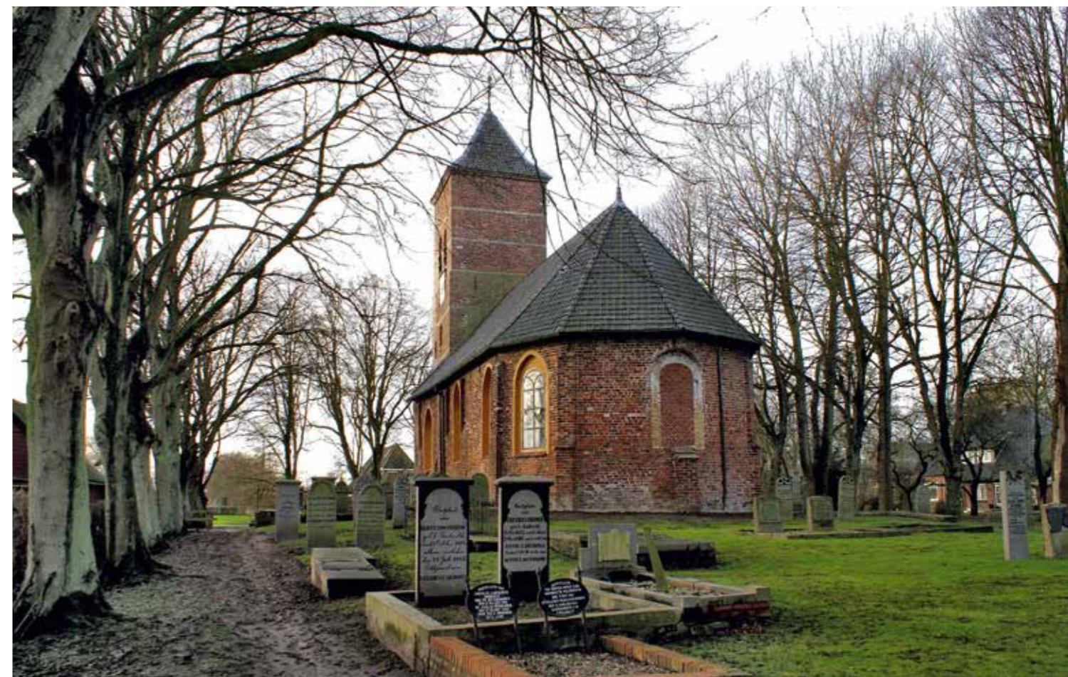
10 De kerk van Noorddijk.