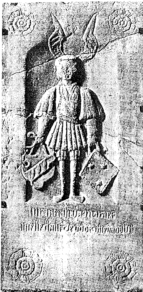
1. Grafzerk in de Nicolaikerk te Appingedam uit 1542 met de wapens Clant en Ufkens.

Het omslag van dit tijdschrift wordt gesierd door een viertal familiewapens. Eén daarvan, dat van de familie Rengers, is de meeste lezers ongetwijfeld bekend: we vinden het terug in vele Groninger kerken op familiebanken, rouw-